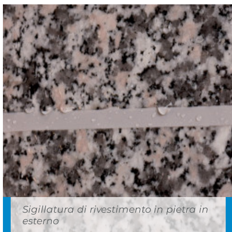
Sigillatura di rivestimento in pietra in esterno

La velocità di reticolazione di Mapesil LM dipende in misura minima dalla temperatura ed è invece essenzialmente legata all'umidità atmosferica presente; è in ogni caso consigliabile non applicare il prodotto a temperature sotto lo zero.