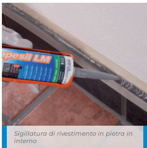
Sigillatura di rivestimento in pietra in interno