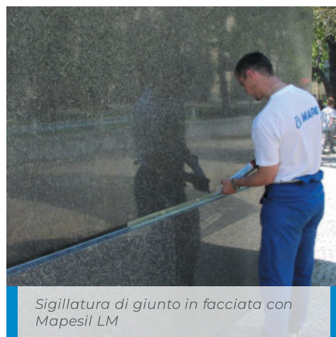
Sigillatura di giunto in facciata con Mapesil LM