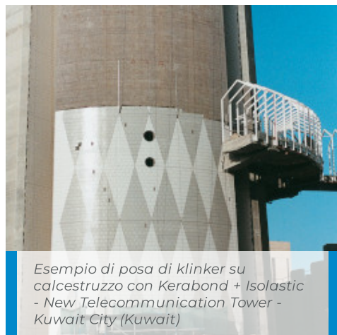
Esempio di posa di klinker su calcestruzzo con Kerabond + Isolastic - New Telecommunication Tower - Kuwait City (Kuwait)